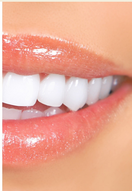
Deutlicher Unterschied: Professionelles Bleaching beim Zahnarzt wirkt!