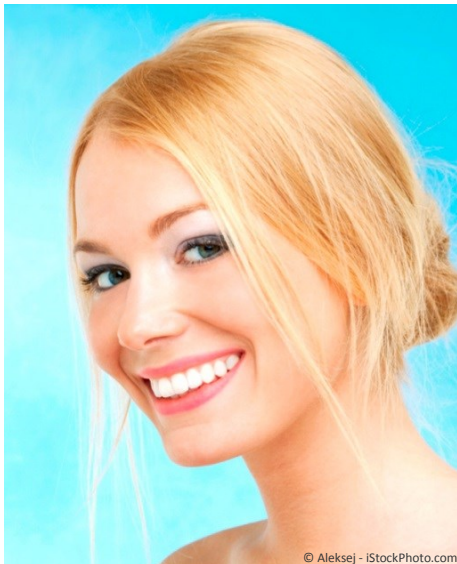
Bleaching vom Zahnarzt: Gewinnendes Lächeln mit strahlend weißen Zähnen