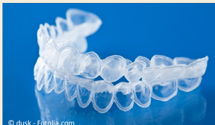
Bleaching-Form aus Kunststoff, in die Sie das Aufhellungs-Gel einfüllen.

Beim Home-Bleaching werden vom Zahnarzt dünne flexible Formen aus einem transparenten Kunststoff hergestellt, die genau auf Ihre Zähne passen (siehe Foto).